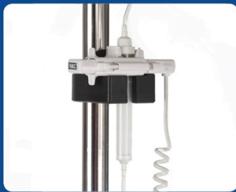
Houder t.b.v. IVAC druppelsensor Ø18 en Ø30mm AM2011-031.01 Ø18 en Ø20mm AM2011-030.02 Ø20 - Ø25mm AM2011-030.03