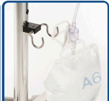
Catheterzakhouder duo Art. nr. Z01-01-303