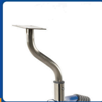
Verkort bovendeel met montageplaat Art. nr. Z01-01-107