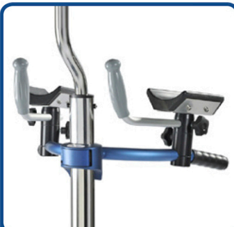
Verstelbare onderarmsteunen Art. nr. Z01-01-304