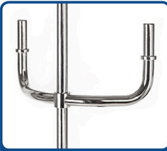
Beugel voor pomphouder Ø30mm Art. nr. Z01-01-108 Ø25mm Art. nr. Z01-01-124