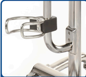
Cilinderhouder voor pomphouder Ø105mm Art. nr. Z01-01-204 Ø122mm Art. nr. Z01-01-205