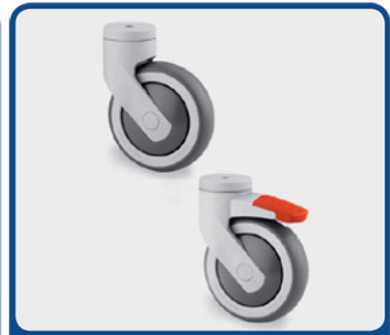
Mobilyzer wielenset, wielen van kunststof Art. nr. Z01-01-306