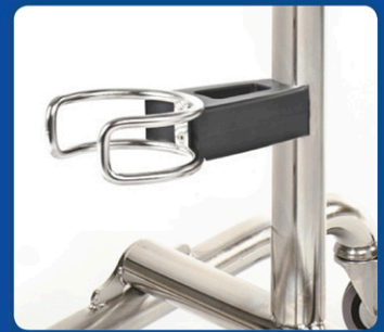
Cilinderhouder Ø105 mm Art. nr. Z01-01-201 Ø122 mm Art. nr. Z01-01-202