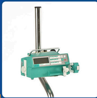
Verkort bovendeel Art. nr. Z01-01-115