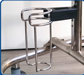
Cilinderhouder met kooi Ø105mm Art. nr. Z01-01-203 Ø122mm Art. nr. Z01-01-206