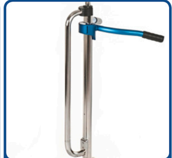
Pomphouder Art. nr. Z01-01-105