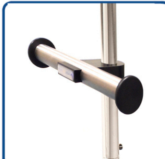
Buis Ø30mm voor pomphouder Völker Art. nr. Z01-01-255