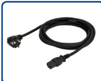
Netsnoer 1,8 meter Art. nr. AM2012-033.1051 3 meter Art. nr. AM2012-033.1052 5 meter Art. nr. AM2012-033.1053