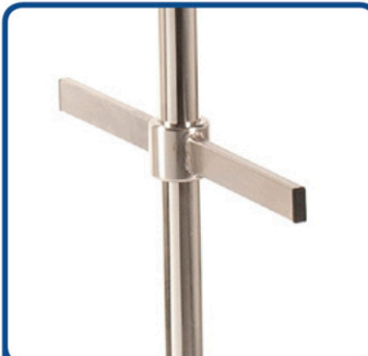
DIN-rail voor pomphouder Art. nr. Z01-01-119