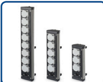
Contactdoos met IEC net-aansl. 8 voudig Art. nr. Z01-01-153 5 voudig Art. nr. Z01-01-151 3 voudig Art. nr. Z01-01-152